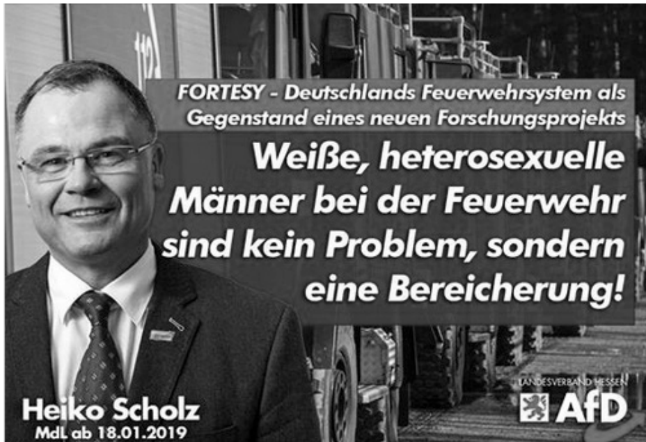
Abbildung 1: AfD zu FORTESY